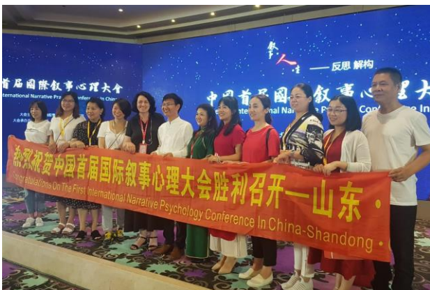
מכון ברקאי העביר הרצאה וסדנה על טיפול זוגי נרטיבי בכנס הבינלאומי הראשון לפסיכולוגיה נרטיבית בבייג'ינג בקיץ 2019

מסלול זה כל סטודנט בוחר את הקורסים התיאורטיים שילמד ואת ההכשרה המעשית שיעבור, ואת העיתוי (כפוף לאישור המכון).