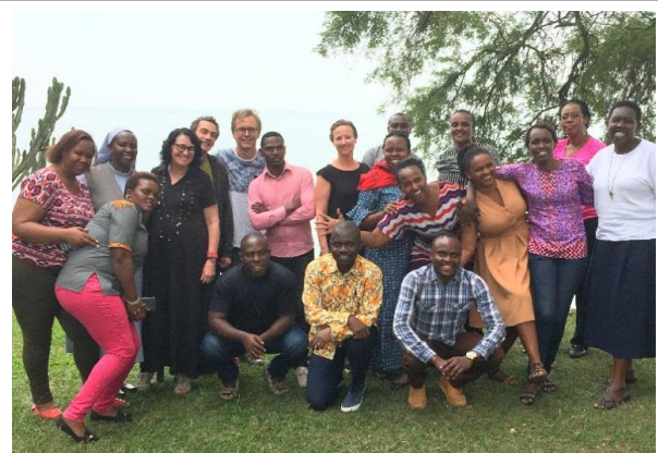
מכון ברקאי העביר קורס בטיפול בהשפעות טראומה ואבל לפסיכולוגים ועו"סים ברואנדה בקיץ 2018