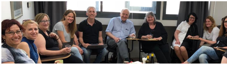
פרופ' קארל טום במכון ברקאי. פרופ' טום הוא פרופ' לפסיכיאטריה באוני' קלגרי ועמית במכון טאוס בקנדה – ומטפל משפחתי זוגי פורץ דרך. הוא אחד מאבות גישת ההבניה החברתית והטיפול המשפחתי בזרם הרפלקסיבי.

לצוות הישראלי מצטרפים מטפלים מהשורה הראשונה מהעולם, אשר מעבירים סדנאות במכון ולעיתים מצטרפים לשיעורים בקורסי ההכשרה השוטפים ומעשירים אותם בידע, שיטות ונסיון הייחודי שלהם ( הקליקו כאן לסגל הבינלאומי שלנו ).