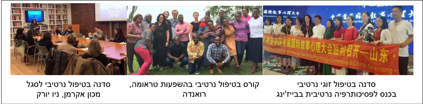
סדנה בטיפול נרטיבי לסגל מכון אקרמן, ניו יורק

אנו מלמדים את הגישה נרטיבית בארץ וברחבי העולם - באוניברסיטאות, מכונים וכנסים מקצועיים.